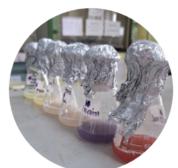
Bioactive pigment-producing bacteria